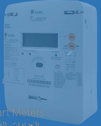
Smart Meters العدادات الذكية