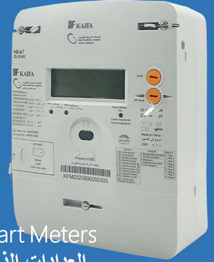
Smart Meters العدادات الذكية