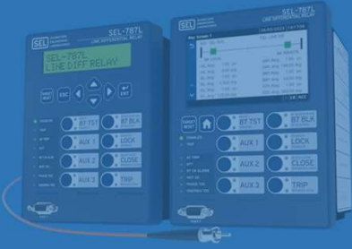
Protection Relays مرحلات الحماية