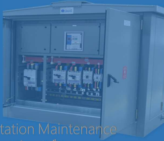
Substation Maintenance صيانة المحطات