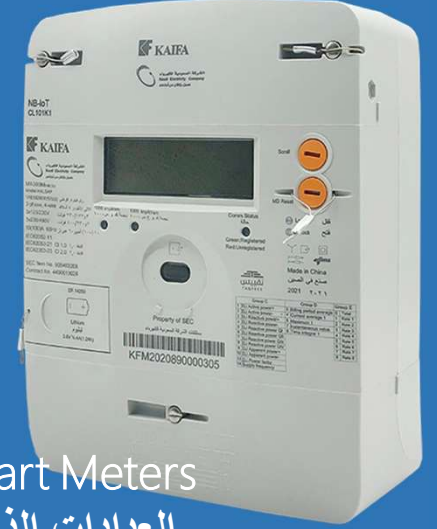
Smart Meters العدادات الذكية

Supply – Apply - maintenance توريد – تركيب – صيانة