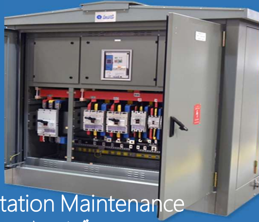
Substation Maintenance صيانة المحطات