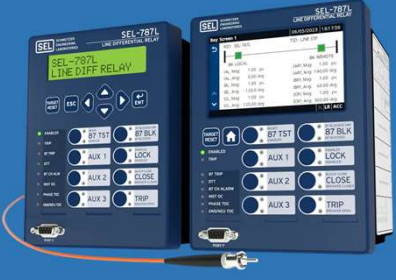
Protection Relays مرحلات الحماية