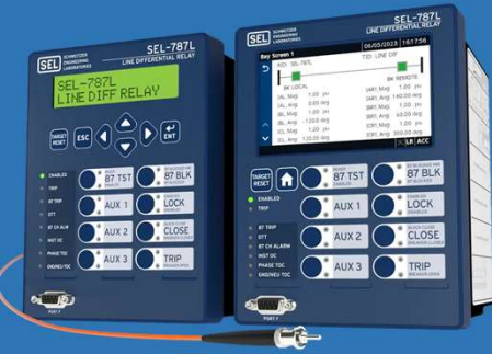
Protection Relays مرحلات الحماية