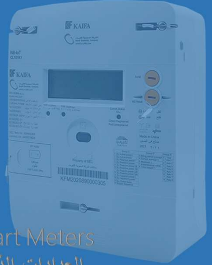
Smart Meters العدادات الذكية